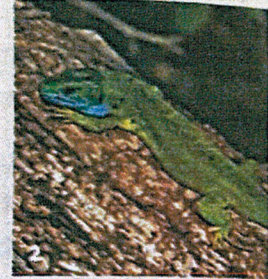
1. Piment royal ( Myrica gale ), protection régionale, extrêmement rare 2. Lézard vert ( Lacerta viridis ), espèce déterminante